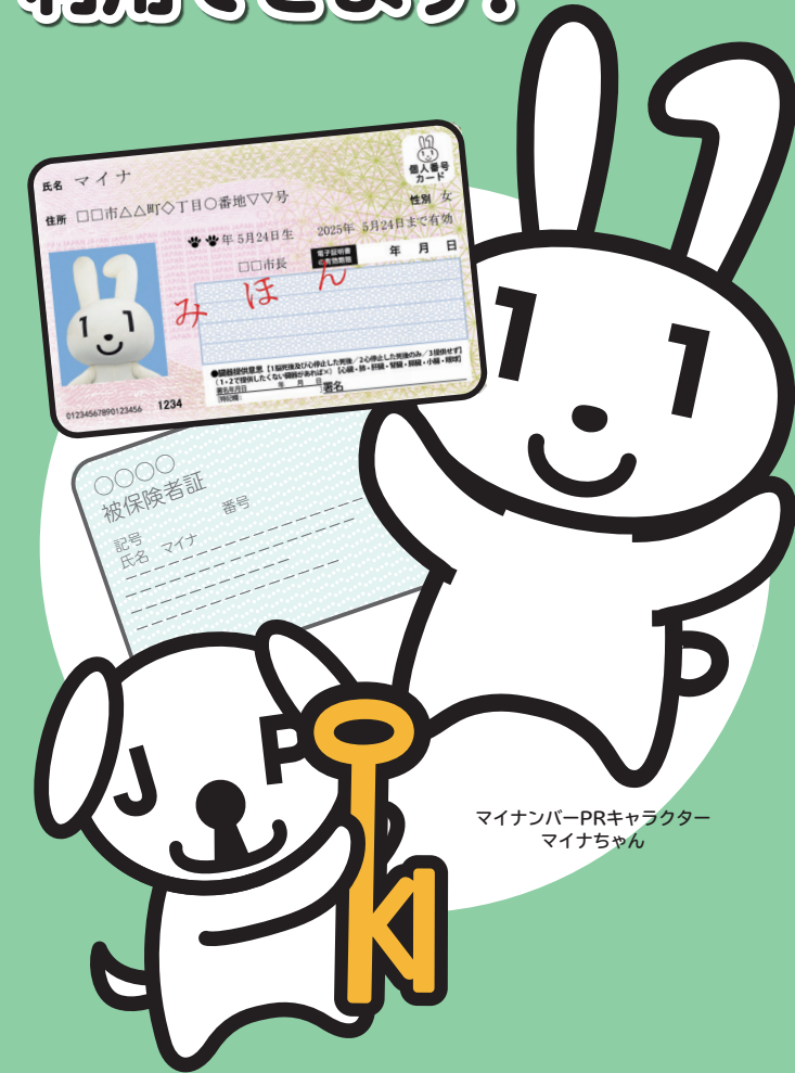
マイナンバーPRキャラクター マイナちゃん